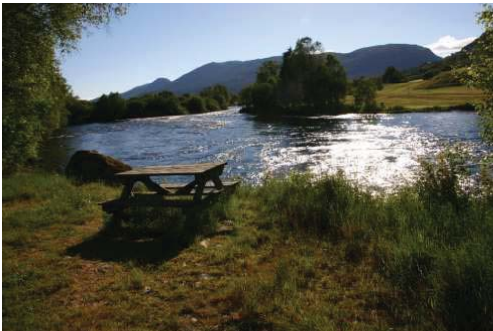
Rasteplassen gir åpning og tilgang til vassdraget.

Eksempler på at det trengs åpning for å sikre tilgang til vassdraget, er adkomst til fiskeplasser og brygger. Kravet til kantvegetasjon gjelder også der stier legges langs vassdraget. Disse må legges et stykke fra elvebredden, men med avstikkere til elvebredden på egnede plasser. Dette gjelder for eksempel for utsiktspunkt, rasteplass og bading. Utsikt til vassdraget omfattes ikke av unntaksbestemmelsen.