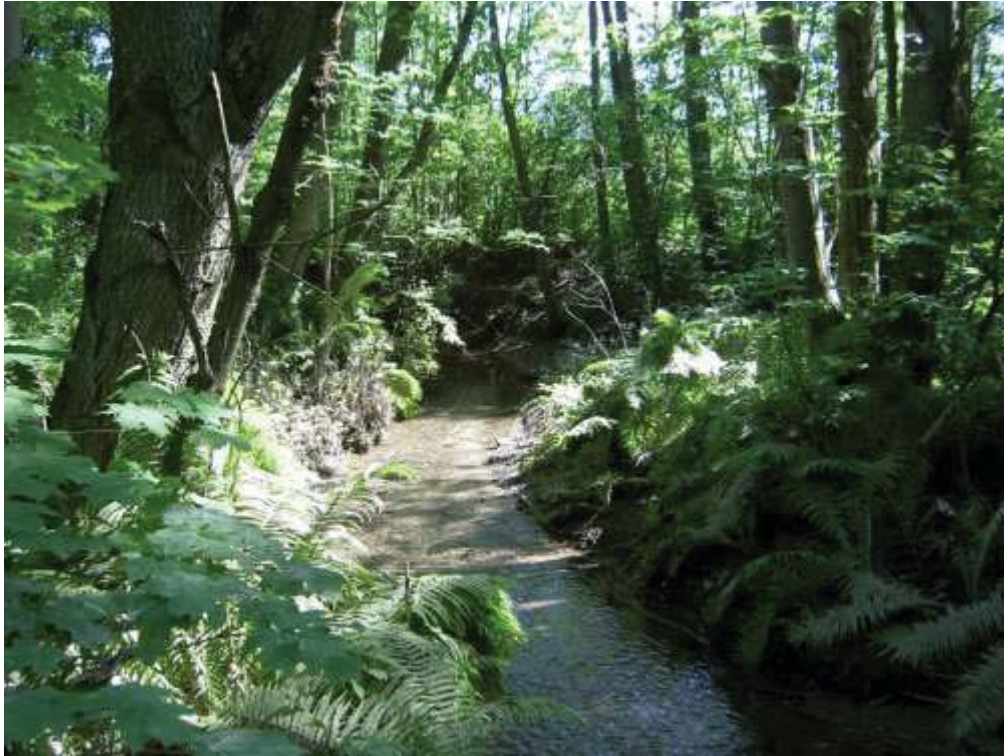
Frodig kantvegetasjon langs Sandvikselva.

Kantvegetasjonen reduserer solinnstråling og gir skygge til vassdraget. Begge deler er viktig for mange fiskearter, elvemusling og andre ferskvannsorganismer. Kantvegetasjonens skyggeeffekt er spesielt viktig når vannføringen er lav på sommerstid. Kantvegetasjonen gir fint skjul for fisken, og tett vegetasjon gjør tilgangen vanskeligere for fiskepisende fugl.