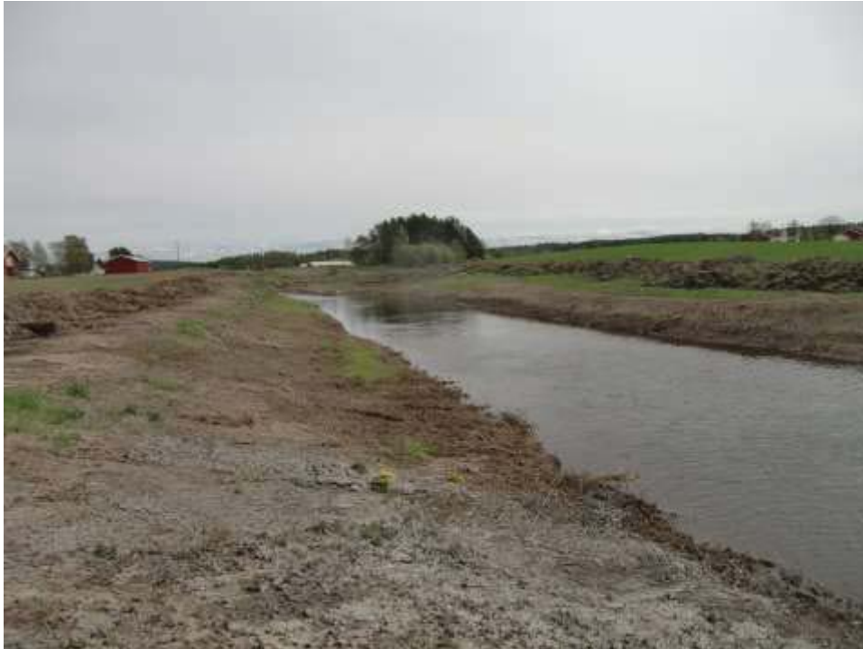
Eksempel på en steril elvbredd.