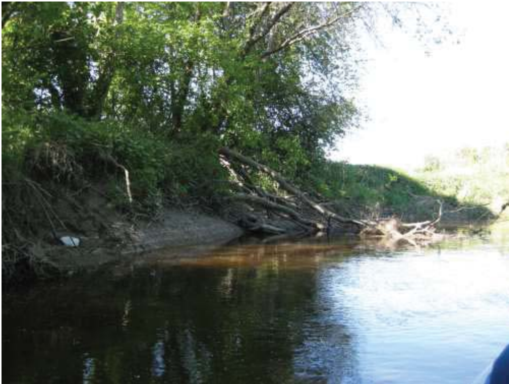
Naturlig erosjon i Hobølelva.

Klimaendringene kan øke kantvegetasjonens betydning som erosjonsvern. Som følge av klimaendringer forventes det at temperaturen og nedbøren vil øke. Den kortvarige intense nedbøren vil øke mer enn gjennomsnittsnedbøren. Det vil bli flere regnflommer og færre flommer forårsaket av snøsmelting. Høyere temperatur vil gi økt fordampning. Dermed øker sannsynligheten for sommertørke, med liten vannføring og lav grunnvannstand. Dette gjelder spesielt i deler av Sør-Norge, hvor sommernedbøren ikke er forventet å øke vesentlig. Disse forholdene vil føre til redusert vanntrykk og påfølgende utrasing (erosjon), og forsterker behovet for godt fungerende kantvegetasjon.