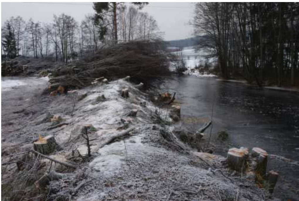
Omfattende hogst langs Dørja i strid med vannressursloven § 11.

Kommunen må både vurdere om kravet til vegetasjonssone etter landbruksregelverket og om kravet til naturlig kantvegetasjon etter vannressursloven § 11 er oppfylt når nydyrking eller tilskudd godkjennes.